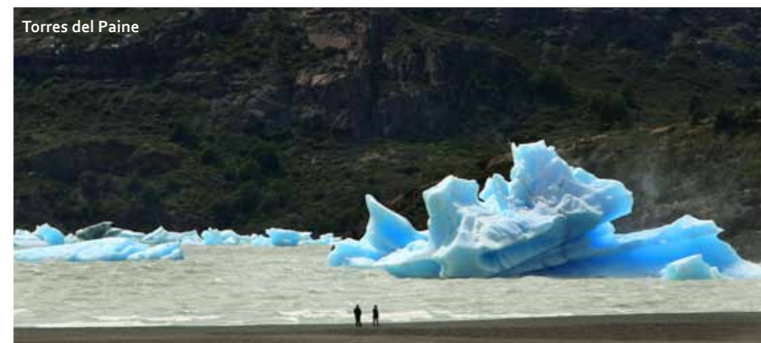
Torres del Paine

Der Besucher kann in ein warmes Weinbad, aus zwei Litern besonders behandelten Carmenère, dem das Aroma, die Viskosität und der Alkohol entzogen wird, steigen und dem Mineralwasser und Hafer zugesetzt wird. Diese Mischung hat eine oxidationshemmende Wirkung und Peeling-Eigenschaften, wodurch nicht nur eine Verjüngung sondern auch eine Reinigung der Haut erreicht wird.