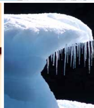
Exposición Fotográfica Museo Bellas Artes