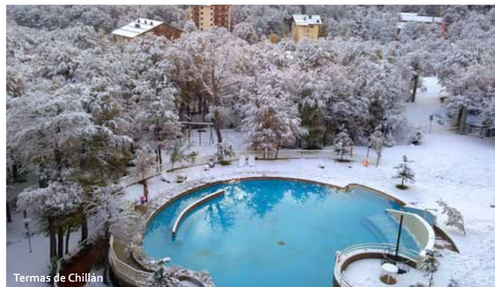
Termas de Chillán

Dem anfänglichen Bauplan entsprechend, wird das Bauprojekt wenigstens zwölf Monate beanspruchen, womit es im zweiten Halbjahr des Jahres 2011 fertiggestellt sein dürfte.